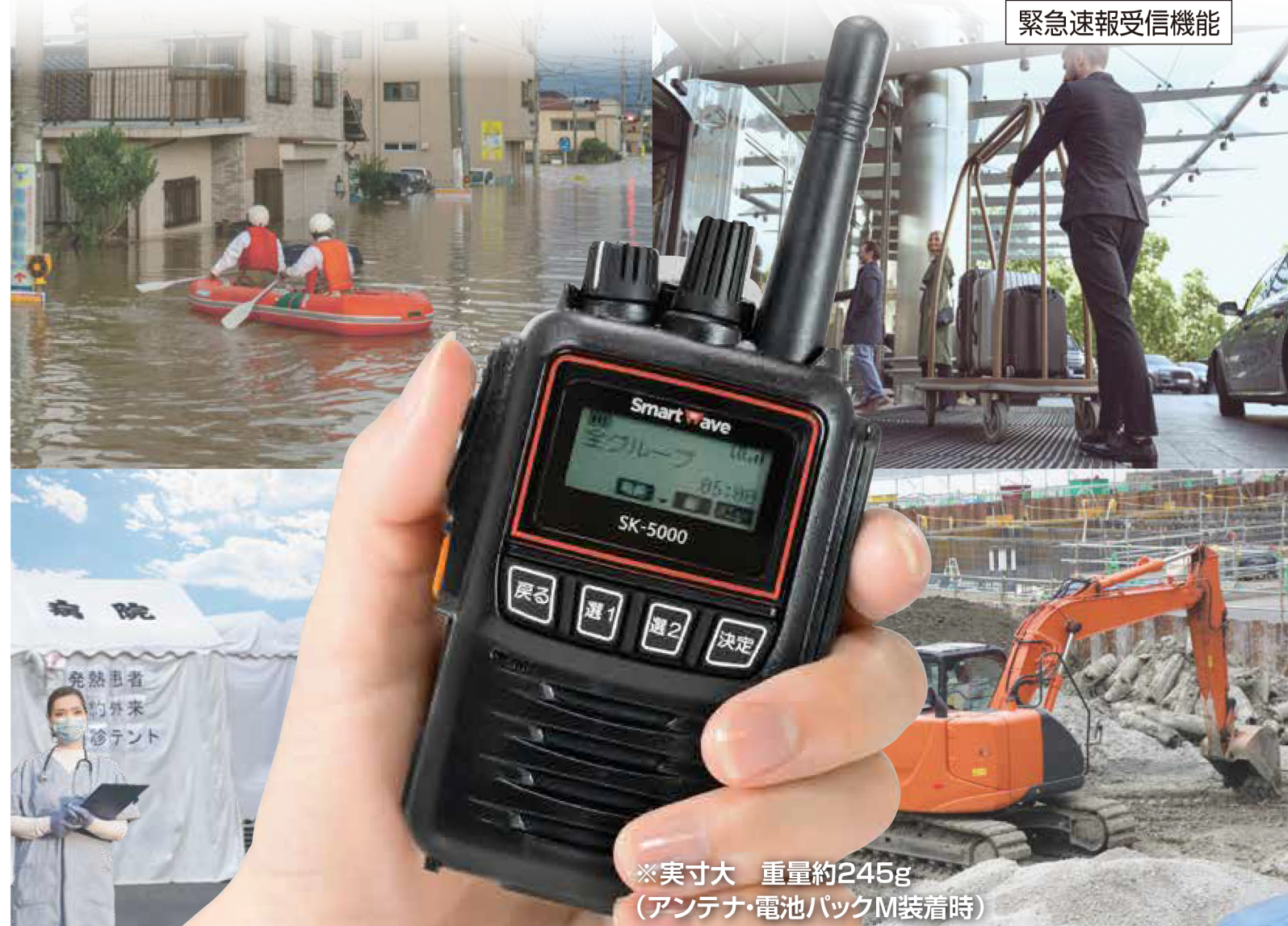
※実寸大 重量約245g (アンテナ・電池パックM装着時)