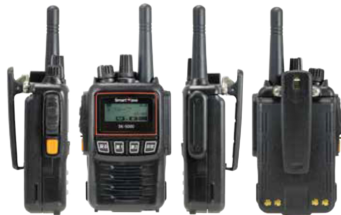
ドコモビジネストランシーバ認定品