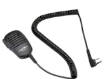
スピーカーマイク SK-M01 (スピーカー出力0.5W 3.5φイヤホン端子付き)

※運転中のイヤホン、ヘッドホンの装着は各都道府県の条例で規制されている場合があります。