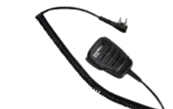
防水スピーカーマイク SK-M04 (IP67*相当防水・防塵性能 スピーカー出力0.5W)