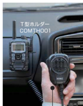
大音量防水スピーカーマイク MP68