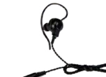
スピーカーマイク用 イヤホン SK-E01 (ケーブル長 約0.5m)