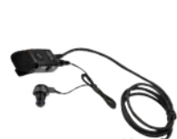
ネックタイピン マイク SK-M02