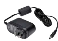
急速充電器用ACアダプタ SK-P03