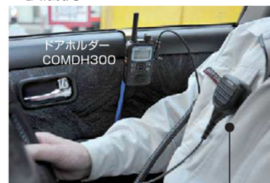
大音量スピーカーマイク MP16