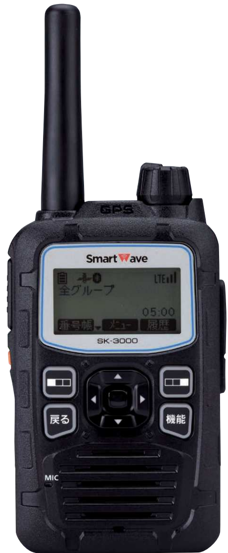
実寸大 重量 約250g (アンテナ、Li-ionバッテリーパック装着時)