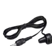
ネックタイピン マイク用イヤホン SK-E03