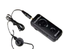
Bluetooth® イヤホンマイク SK-M03