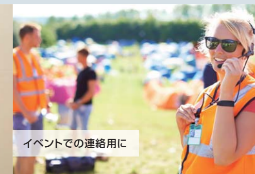
イベントでの連絡用に